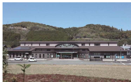
地域福祉センター

〒834-0031 八女市本町599番地 電話 23-0294 (代表) FAX 23-0242