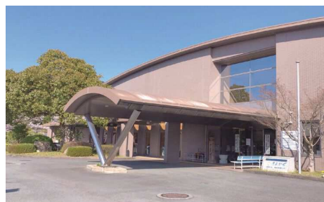
総合保健福祉センター「そよかぜ」

〒834-1402 八女市矢部村矢部字福取田地内 電話 47-3123 FAX 47-3124