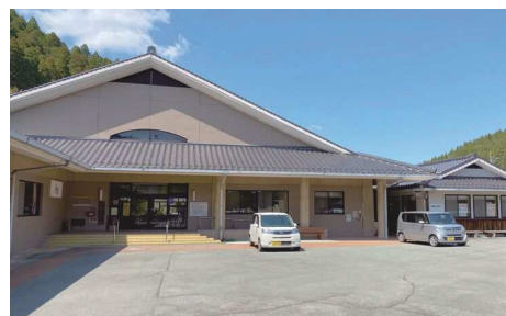
高齢者生活福祉センター

〒834-0074 八女市立花町谷川1156番地 電話 37-0036 FAX 37-0083