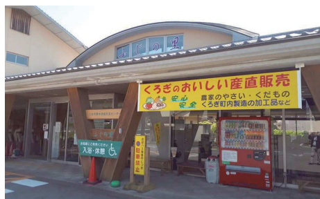
地域交流センター「ふじの里」

〒834-1102 八女市上陽町北川内123番地1 電話 54-3629 FAX 54-3847