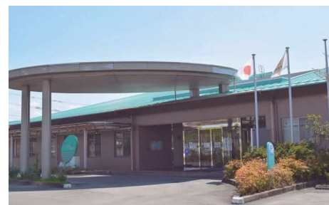
総合保健福祉センター「かがやき」

〒834-1216 八女市黒木町桑原207番地1 電話 42-2131 FAX 42-3959